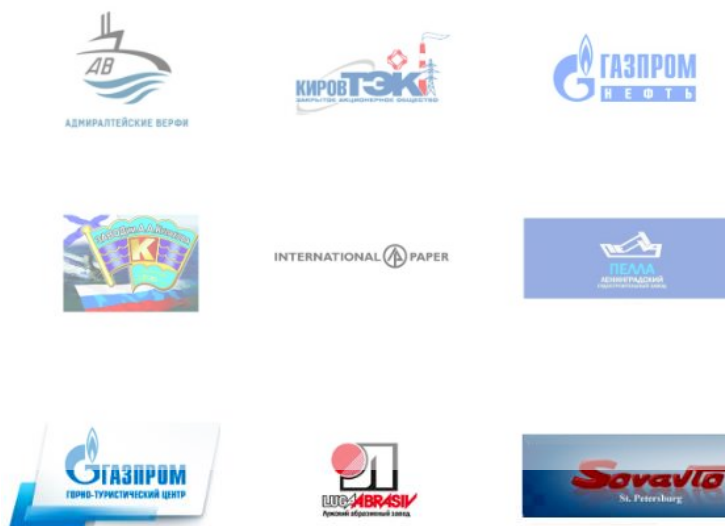
Рисунок 4 - Клиенты ООО ПК «ВентКомплекс»

Клиенты ООО ПК «ВентКомплекс» приведены на рисунке 4.