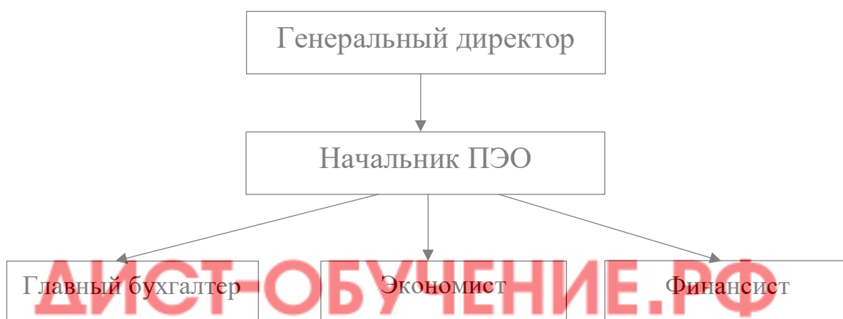
Рисунок 3 - Структура планово-экономического отдела ООО «ПК ВентКомплекс»

Структура планово-экономического отдела ООО «ПК ВентКомплекс» представлена на рисунке 3.